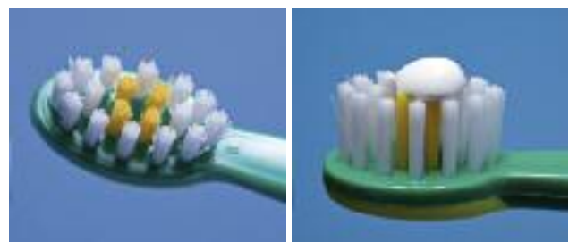
Abb. 3: Kinderzahnbürste mit Dosierhilfe. – Abb. 4: Erbsengroße Zahnpastamenge.

Wenn Kinder auch bereits im Alter von zwei bis drei Jahren selbstständig mit der Zahnbürste Zahnputzbewegungen ausführen können, ist das Nachputzen bzw. Putzen durch die Eltern unabdingbar. Kinder können selbstständig adäquat Zähne putzen, wenn sie in der Lage sind, ihren Namen zu schreiben bzw. selbstständig Haare waschen und föhnen können. Trainiert werden sollte mit den Kindern